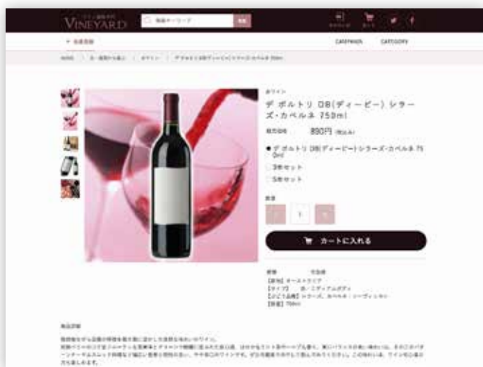
サンプル：ワインショップの商品ページ

! 軽減税率の設定 (2019年10月1日より) それぞれの商品詳細ページ 内で商品ごとに 軽減税率 が 設定いただけます。←p.2