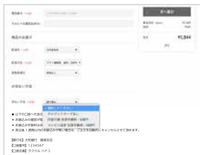
サンプル: ショッピングカート注文画面情報入力ページ

支払い方法名を独自にすることで手数料を追記したり、説明文に銀行口座振込先が記載できます。