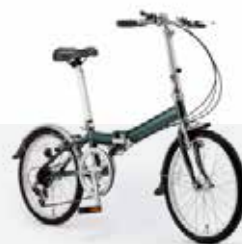
Green Bike 30,000円